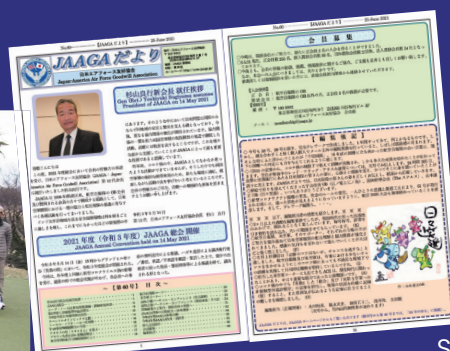
Publish the JAAGA DAYORI