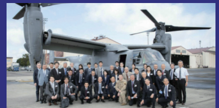
Conduct study tours of USAF Base in Japan