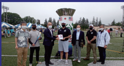
Support USAF members to organize local activities "Special Olympics"