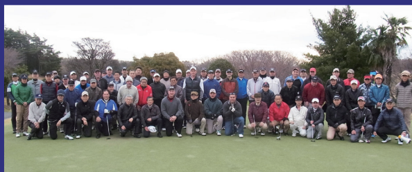
Conduct friendship golf competition "SPORTEX"