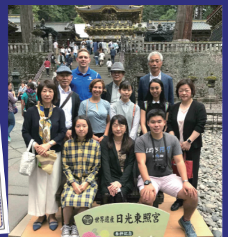
Support USAF members in their study of Japanese culture