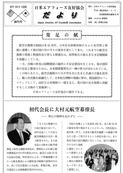
「JAAGA だより創刊号 1996.10.1」