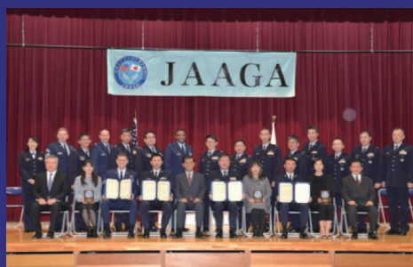
Commend Koku-Jieitai & USAF Brilliant Airmen