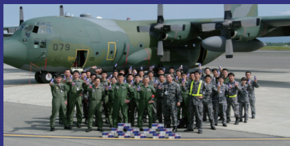
Encourage participants in overseas joint trainings