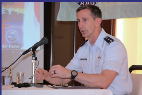
Lecture by Commanders and Generals of Koku-Jieitai and USAF